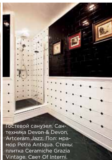
Гостевой санузел. Сантехника Devon & Devon, Artceram Jazz. Пол: мрамор Petra Antiqua. Стены: плитка Ceramiche Grazia Vintage. Свет Of Interni.