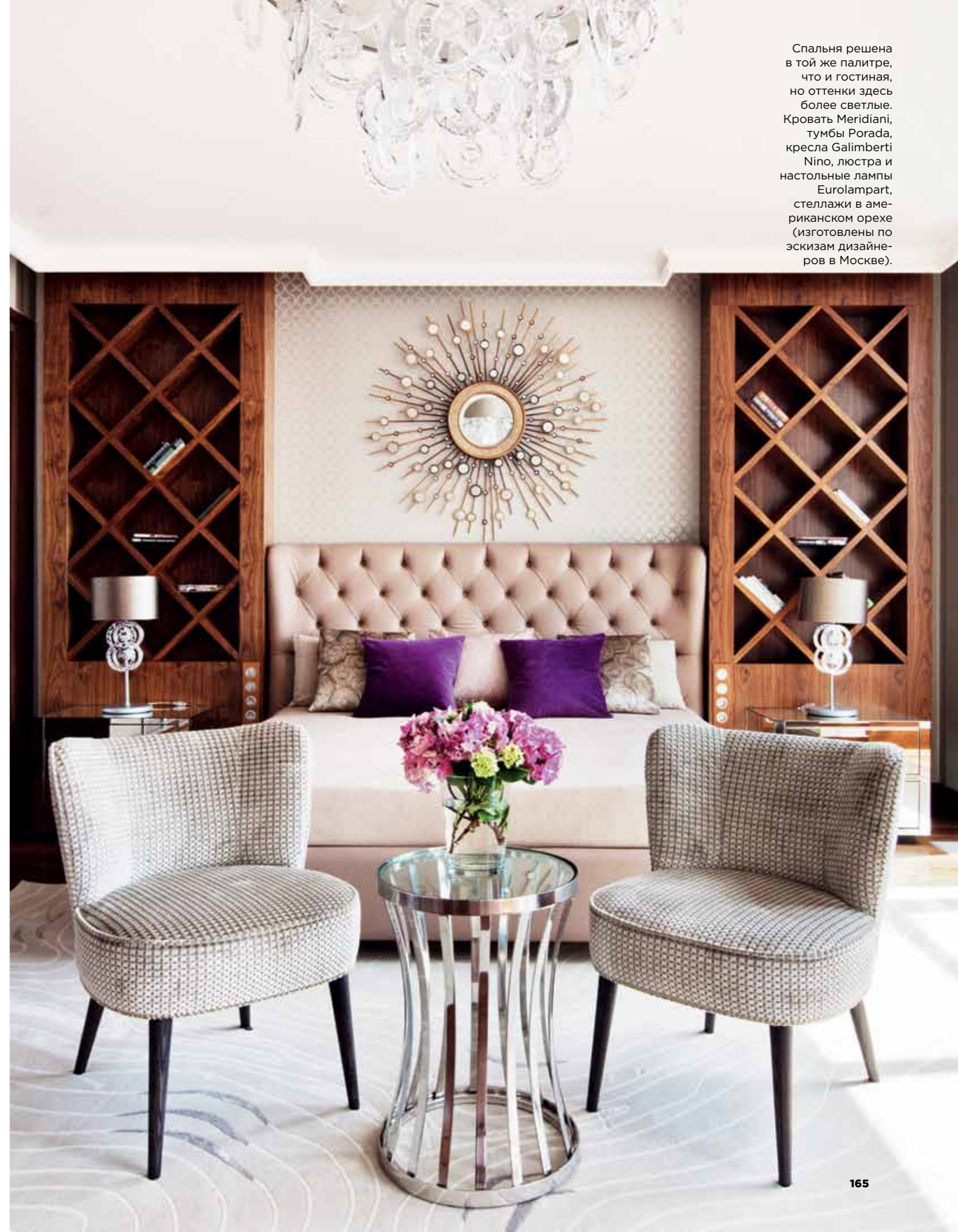
Спальня решена в той же палитре, что и гостиная, но оттенки здесь более светлые. Кровать Meridiani, тумбы Porada, кресла Galimberti Nino, люстра и настольные лампы Eurolampart, стеллажи в американском орехе (изготовлены по эскизам дизайнеров в Москве).