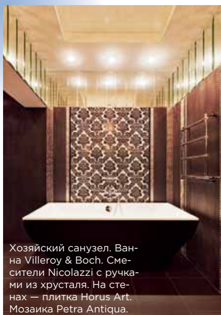
Хозяйский санузел. Ванна Villeroy & Boch. Смесители Nicolazzi с ручками из хрусталя. На стенах — плитка Horus Art. Мозаика Petra Antiqua.