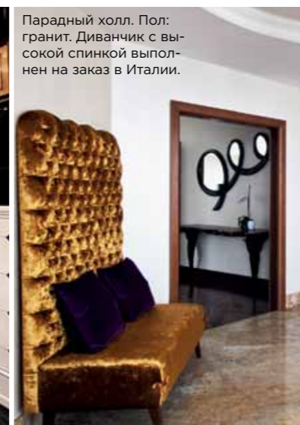
Парадный холл. Пол: гранит. Диванчик с высокой спинкой выполнен на заказ в Италии.